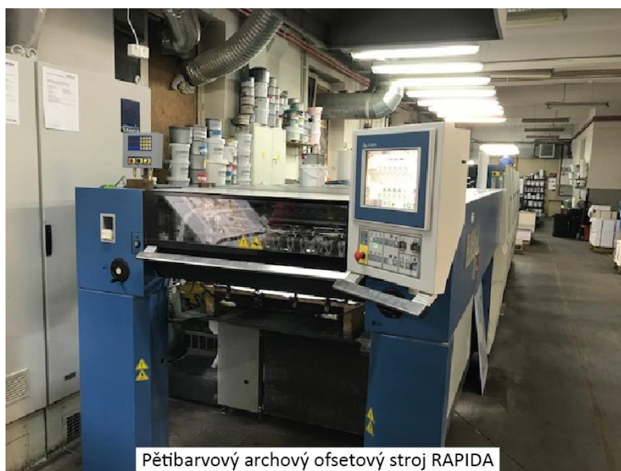
Pětibarvý archový ofsetový stroj RAPIDA